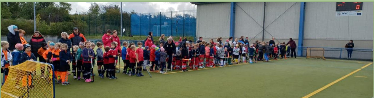
TeilnehmerInnen des Minihockeyturniers

Viel Lob gab es für die sehr gute Organisation des Turniers von den angereisten Teams. Ein besonderer Dank gilt deshalb den vielen – meist jugendlichen – Helfern, die als Teambetreuer, Kampfrichter oder Schiedsrichter zum Erfolg des Turniers beitrugen.