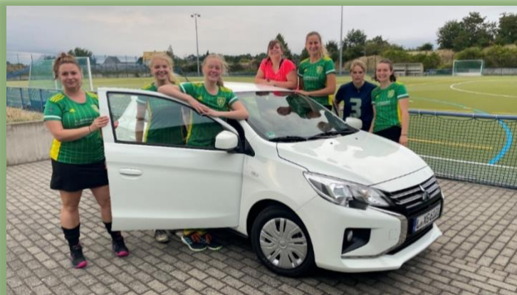
Mitsubishi SpaceStar der Firma Intec GmbH

Am Freitag, den 05.08.22, wurde beim Training des Damenteamts ein Mitsubishi SpaceStar an die HockeyspielerInnen übergeben. Das Fahrzeug kommt vom Sponsor INTEC GmbH und steht ab sofort den Tresenwalder SportlerInnen für Fahrten zum Training bzw. Punktspielen zur Verfügung.