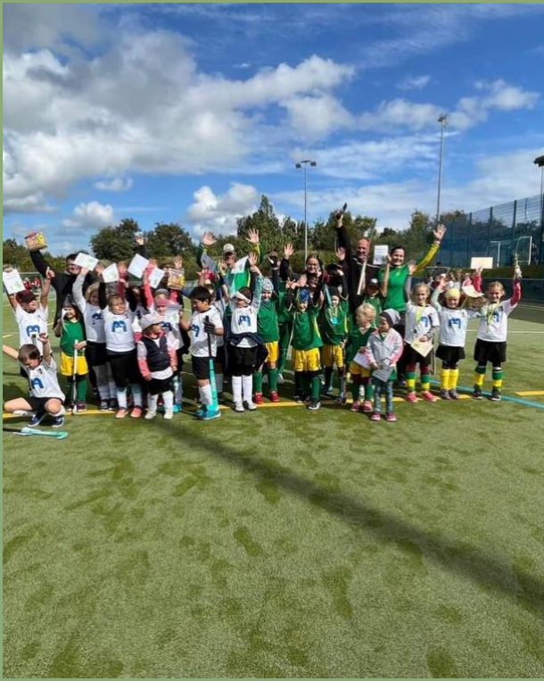
So sehen SiegerInnen aus!