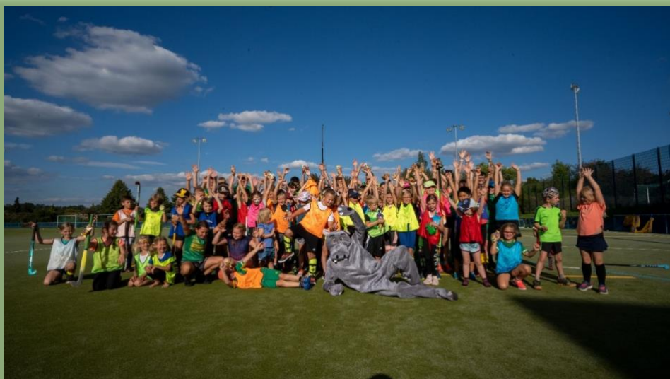
Bis zum nächsten Jahr