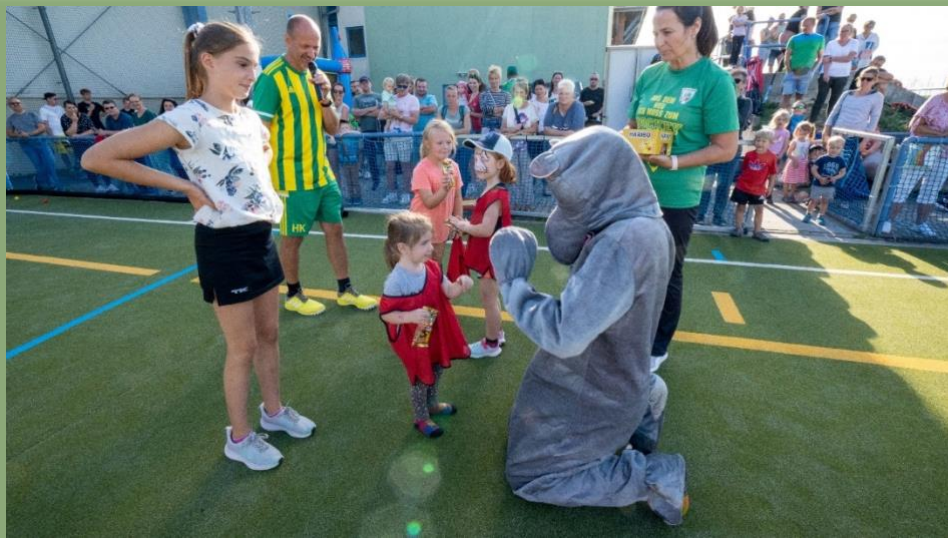
Siegerehrung der Kleinsten