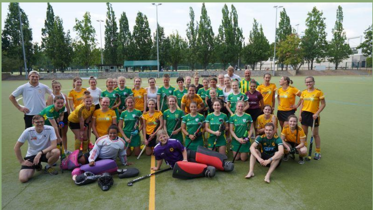
Tresenwalder Damenteam auf Saison Vorbereitungsturnier in Berlin